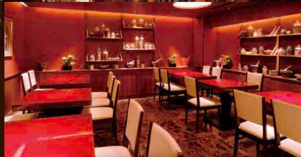
パーティールーム / 14~24名様ご利用可能