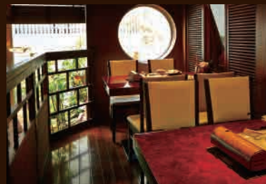
コテージ風高床のお席 / 8名様までご利用可能 少人数でのお誕生日会などに