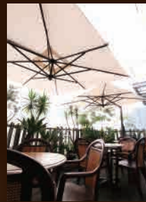
テラス / 暖かい季節には最高のテラス