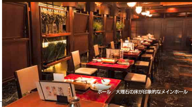
ホール / 大理石の床が印象的なメインホール